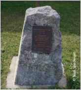
Gedenkstein an der Rudolf-Diesel-Straße, aufgestellt von der Fa. Hogri 2007