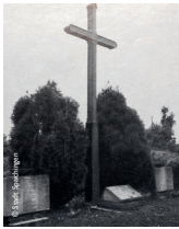
KZ Ehrenmal 1945-1963

In einem der sogenannten „Rastatter Prozesse“ vom 9. Dezember 1946 bis 21. November 1947 und im Hechinger Kriegsverbrecherprozess von 1963 wurden Zeitzeugen und Beteiligte der Natzweiler-Außenlager befragt und Täter angeklagt.