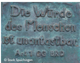
Bodenplatte auf dem Spaichinger Marktplatz

Einige der Täter wurden zu Todesstrafen verurteilt, die auch vollstreckt wurden. Andere wurden zu Haftstrafen verurteilt oder frei gesprochen. Einzelne konnten fliehen und entzogen sich so der Bestrafung. Die meisten der als brutal geschilderten Wachleute, aber auch Führungskräfte, führten nach Freispruch oder früh beendeten Haftstrafen später irgendwo in Deutschland ein bürgerliches Leben. So auch der brutale Spaichinger Lagerleiter Helmut Schnabel, der nach einem Revisionsprozess 1969 nur noch 2 Jahre Zuchthaus abzusitzen hatte.