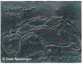
Bronzeplatte, Gedenkpfad „Noch einmal und ihr geht mit“ (siehe Karte rechts)

Bei verschiedenen Gedenkveranstaltungen der Stadtgemeinde, der Kirchen und engagierter Spaichinger Bürgerinnen und Bürger kommen Menschen zusammen, um gemeinsam der Opfer zu gedenken. Stadtführungen und verschiedene Tafeln im Stadtgebiet erinnern an das KZ Spaichingen, an den Leidensweg der Häftlinge und an ihren Arbeitsplatz an der Lehmgrube für die Metallwerke Spaichingen. Der 2017 gegründete Verein „Initiative KZ Gedenken Spaichingen e.V.“ ist Mitglied im Verbund der Gedenkstätten des KZ-Komplexes Natzweiler (VGKN) und widmet sich der Erforschung und dem Andenken der Ereignisse um das Spaichinger Konzentrationslager und seiner Opfer. Seit 2018 ist die Gedenkstätte als Teil des Natzweiler-Komplexes mit dem „Europäischen Kulturerbesiegel“ ausgezeichnet. Die neu gestaltete Gedenkstätte wurde am 29.9.2019 durch die Stadt Spaichingen feierlich eingeweiht.