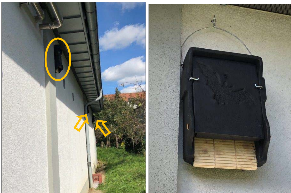
Abbildung 3: Fledermauskästen an der Ostfassade des verbleibenden Gebäudes Links: Übersicht der drei Standorte. Rechts: Detail Kasten 1FF

Da die Gehölze innerhalb des verfügbaren Grundstücks keine ausreichende Stammstabilität aufwiesen, wurden die Kästen an der Ostfassade des verbleibenden Gebäudes, an der Ostgrenze des Plangebiets angebracht (s. Abbildung 2 und Abbildung 3).