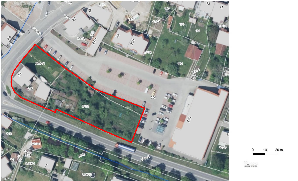
Abbildung 2: Abgrenzung des Untersuchungsgebiets (Plangrundlage: Daten- und Kartendienst der LUBW, 2020)