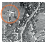
Aufnahme der englischen Luftwaffe, 27. Dezember 1944 (Ausschnitt)

Von August 1944 bis April 1945 stand mitten im Spaichinger Stadtgebiet, ungefähr auf Höhe des heutigen Marktplatzes und des Busbahnhofs, ein Konzentrationslager. Es war eines der rund 70 Außenlager des KZ Natzweiler-Struthof im Elsass.